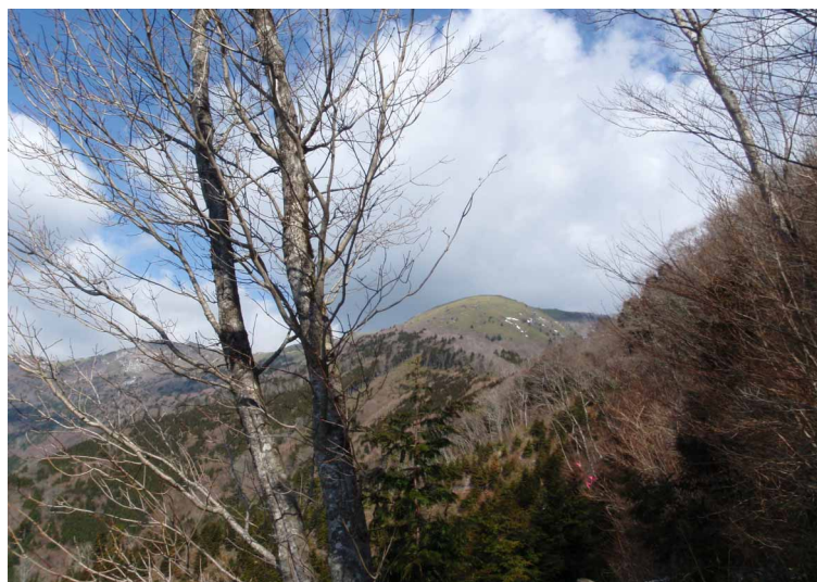
▲ 平家平山頂を望む