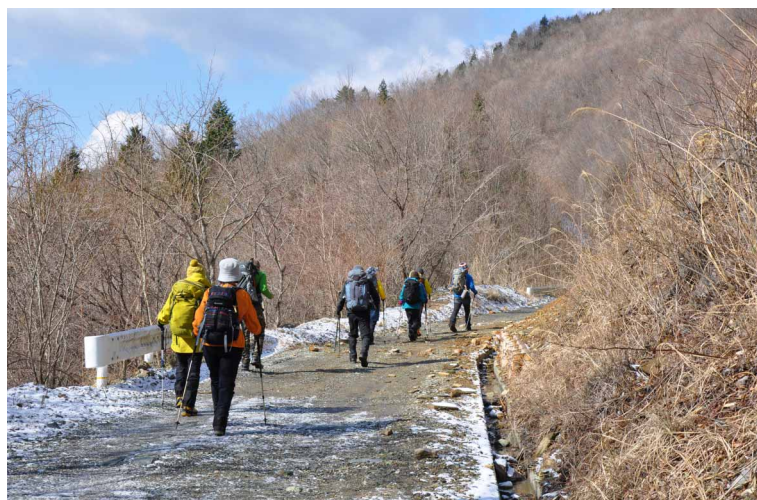
▲ 林道を進むエルク隊